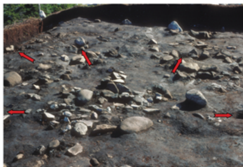
The cluster of rocks in the foreground is a hearth. When in use this was inside a tent. Arrows point to the holes made by the tent poles, long gone.