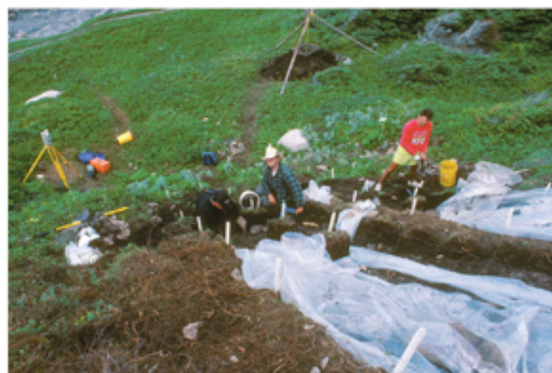
Excavation of the Phillip's Garden West hillside midden (garbage dump)