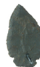
Knife (actual size). This knife could be re-sharpened and was therefore durable.