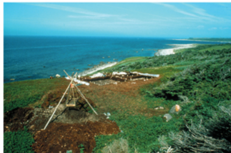
Phillip's Garden West terrace excavations.

On and off between 2500 and 1900 years ago, Groswater Palaeoskimos camped at Phillip's Garden West, probably during the summer. There was very little ancient debris on this small terrace, indicating short stays. The outline of a lightweight tent suggests a warm weather dwelling. Meanwhile, animal bones, toolmaking debris and broken tools were thrown over the terrace edge to form overlapping midden deposits down the slope. The tools from this site were exceptionally well made and they represent the last Groswater Palaeoskimo occupation of Port au Choix.