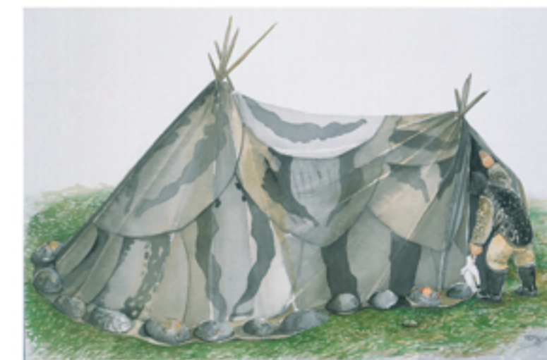
Artist's drawing of what the tent used at this site might have looked like.