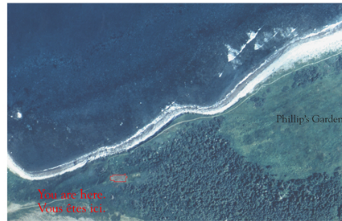
Phillip's Garden West 1991 terrace excavation area. Phillip's Garden is to the east.